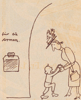
Wo de Heiri die Büchs gseht, lauft er zu siner Muetter und heuscht ihre zäh Rappe, er will öppis inne tue.