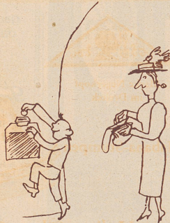
Sini Muetter het Freud gha, daß er Mitlid het mit de n'Arme und git ihm gleitig die zäh Rappe.