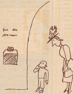
De Heiri rührt sie dri und dänn bleibt er wie agnaglet davor zue stoh. Wo sini Muetter ihn froget, was er denn no well, hüült er luut use: