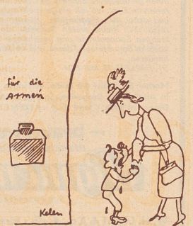
«Warum chunnt denn kei Schokolade use?» — Merket ihr jetzt, uf was er gspitzt hät?