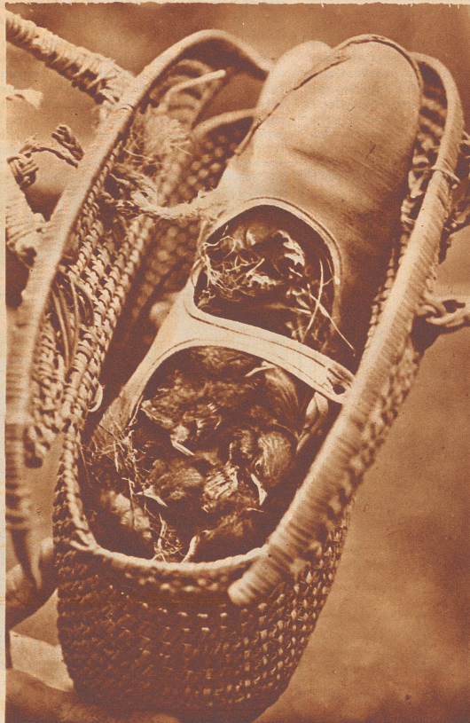
Der Badeschuh und sein lebendiger, ewig hungriger Inhalt. Zu gewissen Tageszeiten sind nur die großen weitaufgerissenen Schnäbel der kleinen Rotschwänzchen zu sehen.