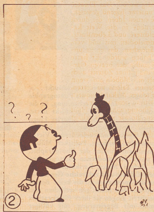
2 Liebevoll will er ihm schmeicheln und versucht es gar zu streicheln.