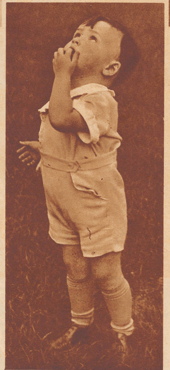
Eigentlich ist es schade um den schönen Ballon, denkt der kleine Bub, aber der Vater hat ihm gesagt, er solle die farbige Kugel fliegen lassen. Am liebsten würde er weinen, denn schließlich bekommt man nicht alle Tage einen so schönen Ballon.

Unterdessen grüßt euch herzlich euer Ungle Redakter.