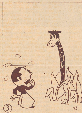
3 Doch das Tier wird lang und länger Mäxchen wird es bang und bängler.