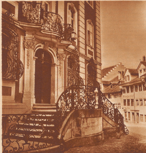
Das schöne Rathaus des Städtchens Bischofszell mit seinen reichverzierten Geländern und Fenstergeräten, wurde 1747 von Bagnoto erbaut.

Etwas von der 12. Spezialtour: Wanderatlas 2A: St. Gallen Nord = Tour Nr. 27 (Halbtagestour) Bischofszell - Hohenstein - Zihlschlacht - Hudelmoos - Hagenwil (Schloß) - Muolen. Bestätigungsstellen: 1. Bischofszell, «Café-Conditorei zur Traube». 2. Zihlschlacht, «Wirtschaft und Metzgerei zum Schäfli». 3. Hagenwil, «Schloßrestaurant». Gültig bis Ende Juni 1934.