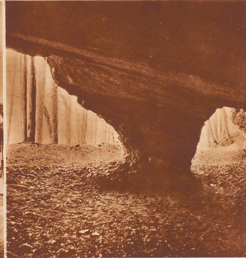
Blick aus der Felsenhöhle bei Hohenstein. Sie diente angeblich den Bischofszellern im Jahre 1273 als Zufluchtsstätte; später wurde sie der Aufenthaltsort eines Verbannenen, namens Henseler, daher ihr Name Henselerloch.