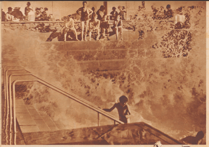
Strom im Badewasser auf dem Dolder! Nein, der Hebel im Mischbehälter ist auf 'Wellenablage' gedreht und von fernher die Glühbirne die gekochten Meeres.