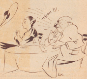
Der moderne Strandstil und was ihm passieren kann.