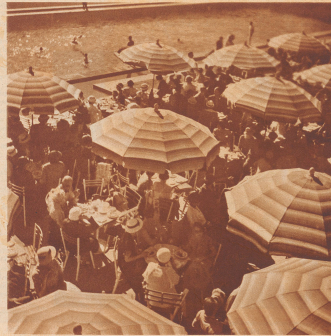
Ringsum sitzen gleich nehmen sich die besten Sommermode aus, die dem Strampelkann und den Badenden erlauben, den 3. Ufer im Schatten einzuatmen.