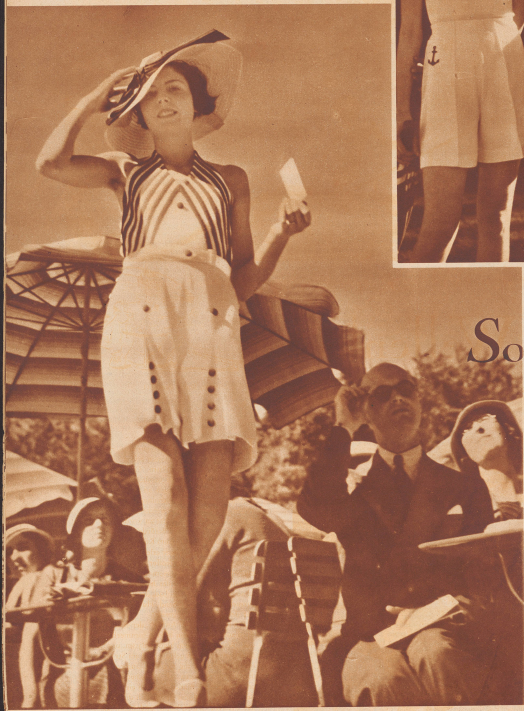
Ein Mannequin in 'skorn'. Die weißen leinenen Strandhosen werden auch beim Tennisspiel getragen.