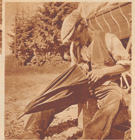
Der Vater Schirmflicker bei der Arbeit. Er muß sich tüchtig ins Zeug legen, weil die Schirme noch am gleichen Abend ins Dorf zurück müssen.

Liebe Kinder, vor kurzem ist der Unggle Redakteur auf einem Sonntagsausflug einer Korb- und Schirmflickerfamilie begegnet, die in einem Wagen wohnte. Diese Leute hat man früher Zigeuner genannt, und man erzählte den Kindern von ihnen schauerliche Geschichten. Man sagte, daß sie Hühner, Kartoffeln und kleine Kinder stehlen — das mit den Hühnern und den Kartoffeln mochte schon stimmen — kleine Kinder hatten sie selbst genug.