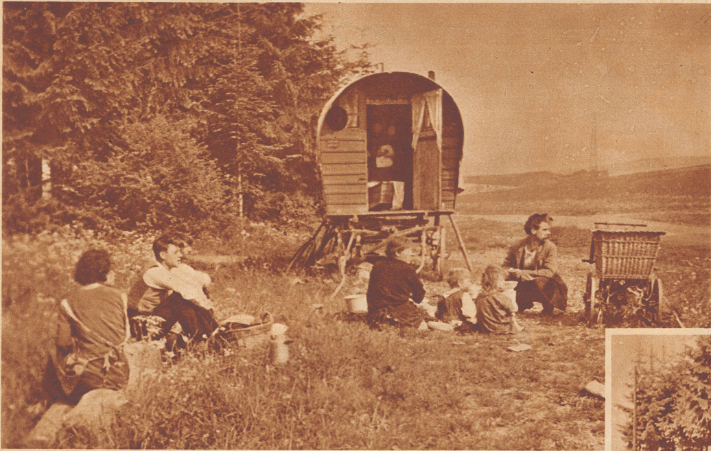
An einem schönen Waldrand haben die Korbflicker über den Sonntag ihren Wagen aufgestellt. Die Kinder spielen im Grase. Vater und Mutter ruhen sich von der mühsamen Wochenarbeit aus.