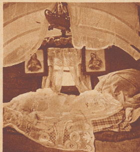
Es sieht nicht gerade ordentlich aus, dieses Bett, aber bei den fahrenden Leuten hat das nichts zu sagen.