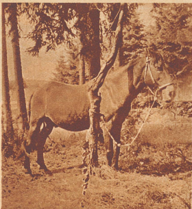
Unter den schattigen Bäumen ist das kleine kräftige Pferd angebunden.