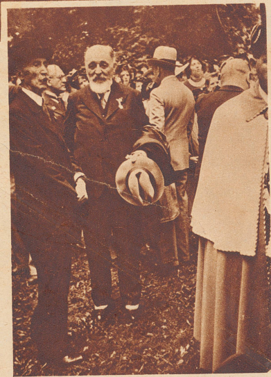
Mit einem großen, bunten Fest, wie es die Westschweiz selten sah, erreichte am Samstag und Sonntag der 8. Rhonekongress seinen Höhepunkt.