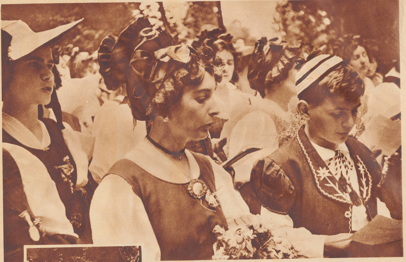
Bild: Der Chor der Waadtländerinnen in ihrer schmucken Tracht bei einem Gesangsvortrag.