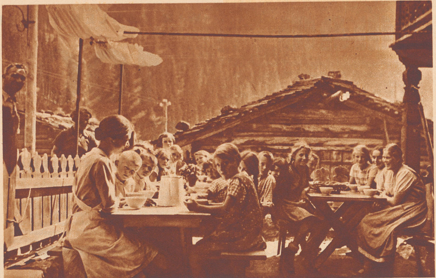
Ferien für Auslandschweizerkinder

Inspektor Carlin war nämlich der Ansicht, daß die gestohlene Beute noch gar nicht aus dem Hotel herausgeschafft worden war, sondern sich noch an irgendeinem versteckten Ort in Berkeley-Hotel befand. Zu dieser Ansicht führte ihn die Erwägung, daß es für die Diebe sehr riskant gewesen wäre, nachts aus dem Hotel auf die durch zahlreiche Bogenlampen taghell erleuchtete Straße mit der in einer Handtasche geborgenen Beute herauszutreten, ohne den Argwohn einer Polizeistreife oder auch der selbst nachts zahlreichen Passanten zu erregen. Der erfahrene Kriminalbeamte vermutete daher, sie würden eher versuchen, die gestohlenen Sachen nach und nach aus dem Versteck hinauszubefördern. Dies Versteck aber mußte, falls ein solches wirklich vorhanden