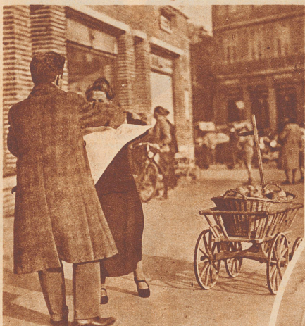
Ein Windstoß hat die Zeitung vom Kartoffelwägelchen fortgeweht, über die Straße. Viele sehen's und sehen die Frau, die etwas ratlos dem fortgeflogenen Blatt nachguckt. Soll sie ihm nachlaufen, soll sie nicht? Da hebt es schon ein junger Mann auf und bringt's zurück. Ein paar Leute hatten die gleiche Regung empfunden und sie nicht ausgeführt. Eine kleine Auffälligkeit war damit verbunden. Die haben sie nicht gewagt! — Habt den Mut, zu euren guten Regungen zu stehen!