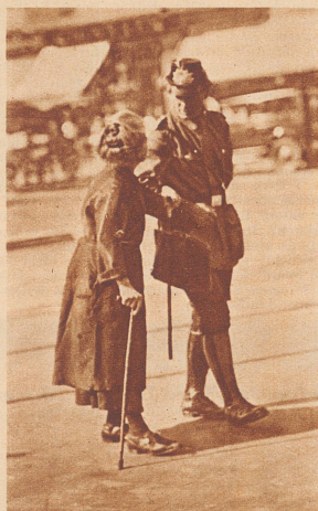
Der Polizeibeamte geleitet ein altes Weiblein über die Straße. Es ist keine von den glänzendsten Aufgaben, von denen, die viel Ehre bringen. Vielleicht gehört sie zu seinen Pflichten, vielleicht nicht. Möglicherweise fällt er mit seinem Tun aus der Reihe, vielleicht fällt er auf; ein wenig komisch sieht er aus in Lack und Glanz mit dem unscheinbaren alten Weiblein am Arm. Aber er kümmert sich nicht darum. Mur im Allerkleinsten! Wir haben ihn durchaus nicht immer.