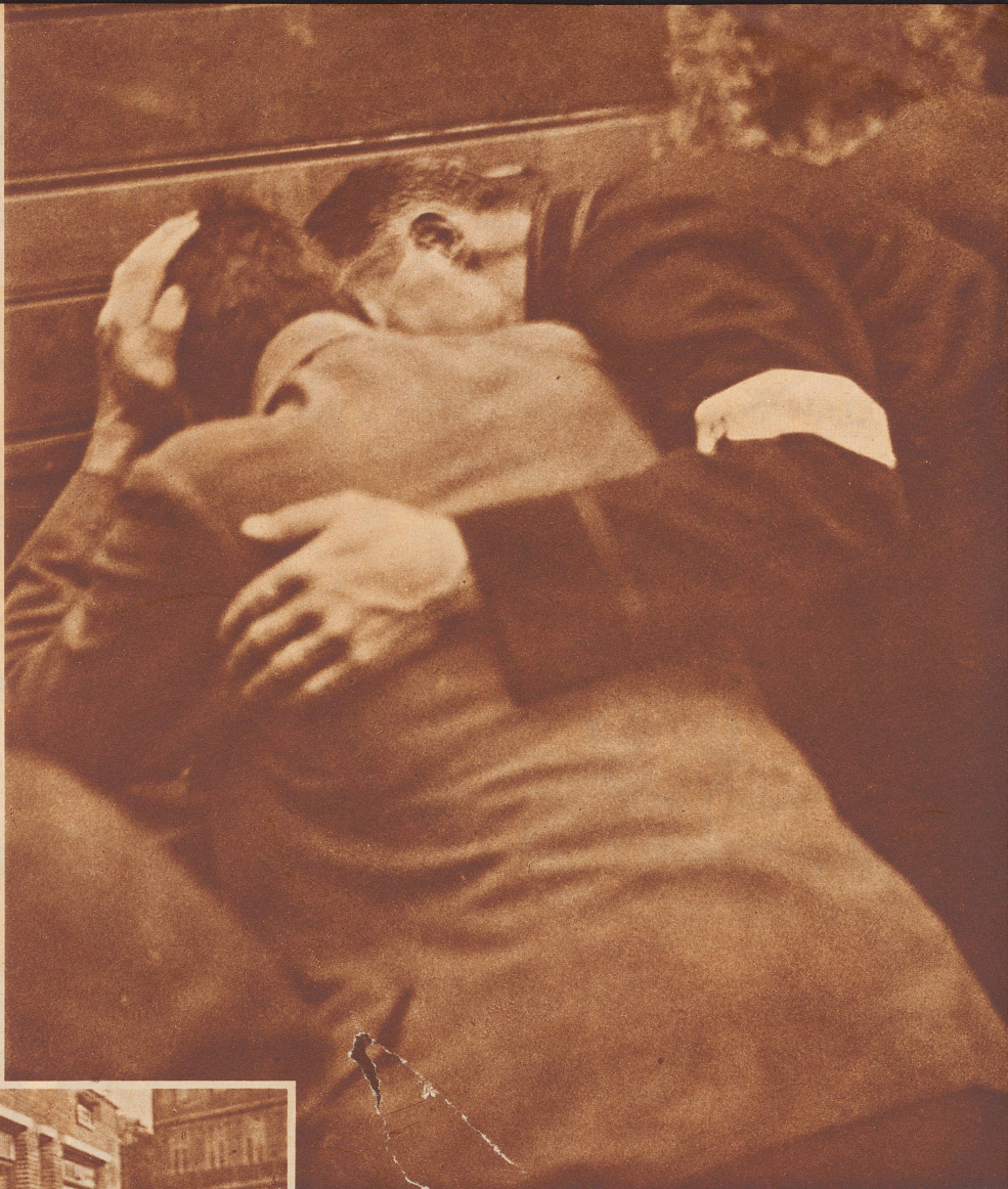
Die ermutigende Gebärde. Welch schöne, kräftigende, wahrhaft menschliche Bewegung! Die Hand auf der Schulter des Verzweifelten. Bei welcher Gelegenheit dieses Bild aufgenommen wurde? Darnach fragen wir nicht. Das tut nichts zur Sache, es steht als Aufruf an diesem Platze, zur Mahnung: Seid Ermutiger!

Ein Kind kommt aus der Schule. «Wie ging's?» fragt die Mutter. «Schlecht», sagt die Kleine, «wir hatten Geographie, da sagte der Lehrer, es leben 1500 Millionen Menschen auf der Erde, aber ich sei die Dümme». Ermutigend, nicht wahr? Wir sind ihm alle im Leben begegnet, dem Lehrer, dem Onkel, dem Vorgesetzten, überhaupt jenem Mitmenschen, der uns für einen Fehler nicht nur tadelte, sondern mit einer gewissen Freude in die tiefste Mutlosigkeit hineinstieß. Unsere Verachtung allen denen, die's aufs Entmutigen abgesehen haben und unsere Liebe und Achtung allen, denen es ums Ermutigen zu tun ist! Ein ermunterndes Wort zur rechten Zeit ist ein köstliches Geschenk, da braucht ein jeder nur an seine Jugend und Werdezeit zu denken. Drum setzen wir vor alle Großtaten des Mutes diese vier Bilder, sie reden vom köstlichsten Mut, den es gibt, — vom Lebensmut. Es ist nicht jedermanns Sache, noch ist jedem im Leben Gelegenheit gegeben, weithin sichtbare Mut-Taten zu vollbringen, aber ein Ermutiger zu sein, wo's nützt, das kann jeder, das ist ein ehrenwertes Werk und trägt wunderbare Früchte.