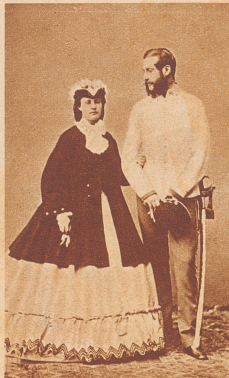
Herzog Philipp von Württemberg und seine Gemahlin Maria Theresia, ein Fürstenpaar, das durch seine Eleganz und Schönheit jahrzehntelang das modische Vorbild aller zum Hof gehörenden Kreise war.