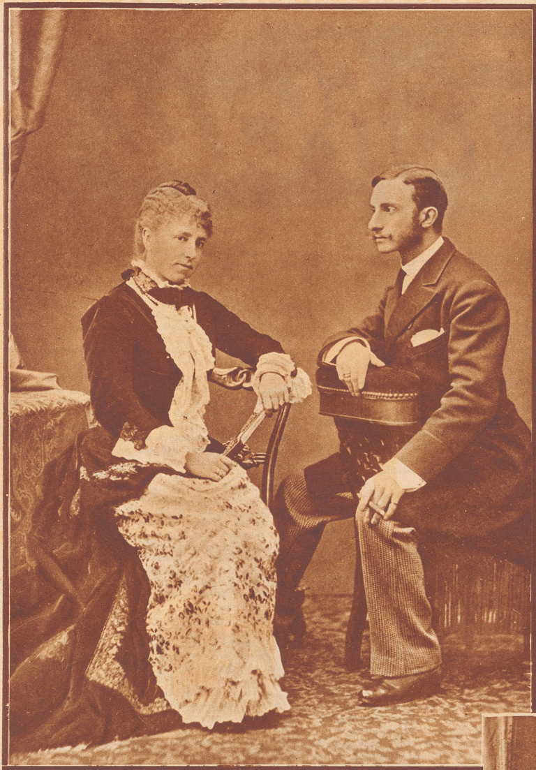
König Alfonso XII. und Königin Christine von Spanien bemühen sich, etwas Saloppheit in ihre Haltung zu bringen. Die lässig drapierte Tournüre der Königin und die «ungezwungen» gehaltene Zigarre ihres Gemahls sollen den Eindruck erwecken, das Königspaar habe sich mit unendlich vornehmer Nonchalance vor den Apparat gesetzt.