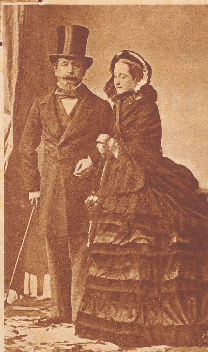
Der französische Präsident und spätere Kaiser Napoleon III. und seine schöne Gemahlin Eugénie waren modische Vorbilder für die französischen Bürger.