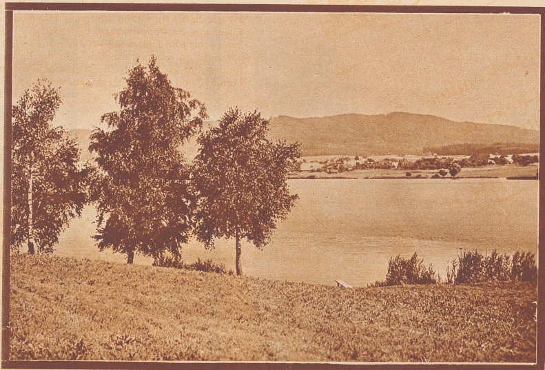
Der liebeliche Moosseedorfsee ist eines der schönsten Ausflugsziele in der Umgebung Berns. Im Hintergrund der Hügellzug des Grauholz.

Da der Wanderatlas «Bern Ost» nunmehr fertiggestellt ist, können wir unsern Wanderfreunden aus dem Bernbiet nun auch in ihrer engern Heimat schöne Spezialtouren mit Wanderprämien vorschlagen. (Näheres darüber, sowie weitere Touren siehe auf Seite 975). Als erste haben wir eine schattenreiche Hochsommerwanderung durch das Grauholz, mit schöner Badegelegenheit im lieblichen Moosseedorfsee gewählt.