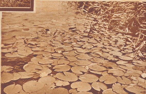
Ein dichtes Seerosenband säumt den See.

Bestätigungsstellen: 1a. Zollikofen, Gasthaus zum «Bahnhof»; oder 1b. Bärswil, Restaurant «Egli». 2. Moosseedorf, Restaurant «Seerose».