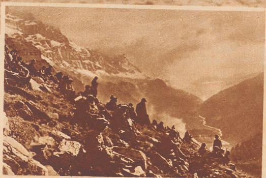
Zuschauer beim Klausenrennen auf der Paßhöhe. Blick auf den Urnerboden.

BULLUS (Deutschland) hält seit 1930 den Klausenrekord für Motorräder. Auf NSU 500 cm 3 brachte er mit einem Stundenmittel von 77,500 km die 21,500 km lange Prüfungsstrecke in 16:41,0 Minuten hinter sich.