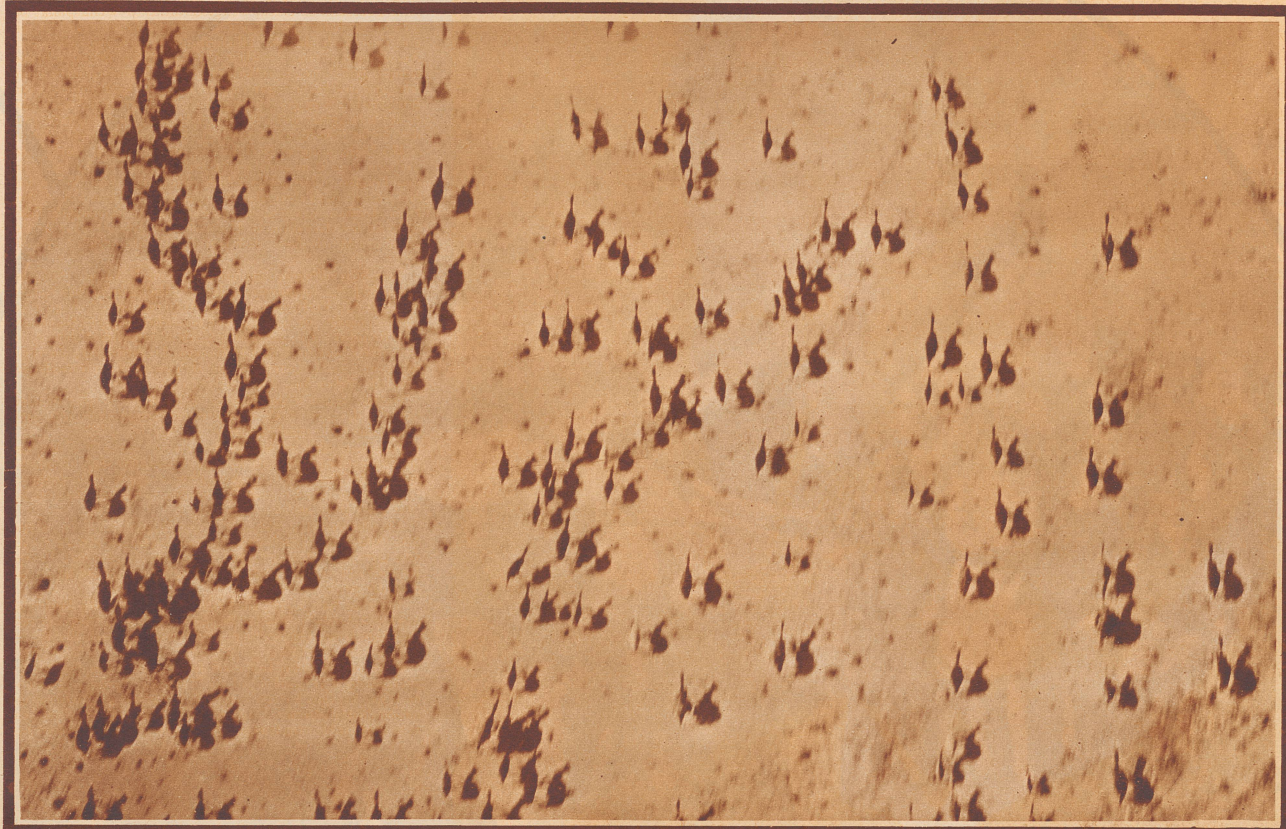
Kamele auf der Flucht bei einem Bombenangriff italienischer Flugzeuge auf eine Eingeborenen-Gruppe bei Hon in Tripolitani. In dem Feldzug, den die Italiener zur Befriedung des Hinterlandes von Tripolitani und der Cyrenaika unternommen haben, kam es vor, daß ganze Kamelherden durch Bombenangriffe vernichtet oder abgetrieben wurden. Die Angreifer sahen darin das wirksamste Mittel, die noch freien Eingeborenenstämme in ihrer Beweglichkeit zu hindern, ihnen möglichst großen Schaden zuzufügen und sie so in kürzester Zeit zur Unterwerfung zu zwingen. Denn: raubt man diesen Bewohnern der Sahara ihre Kamele, die für sie nicht nur Transportier und Lebensmittelpender, sondern auch Handelsobjekte bedeuten, so sind sie dem sichern Verderben geweiht.