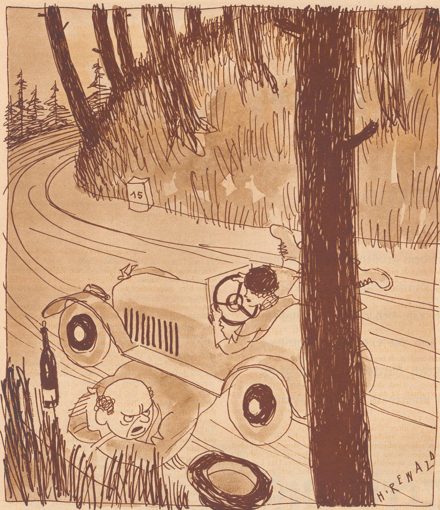
«Machen Sie endlich, daß Sie weiterfahren, sonst stehe ich auf!»

Höher geht's nicht! «Ach, guten Tag, Frau besoldete Stadträtin mit Pensionsberechtigung!» «Grüß Gott, Frau prämierte Mettwurstfabrikant mit elektrischem Betriebe, gehen Sie auch zum Kaffee bei der Frau Bestattungsinstitut auf Gegenseitigkeit?» «Nein, — ich muß zur stellvertretenden Obereisenbahntelegraphenbauinspektionsbürovorsteherswitwe!»