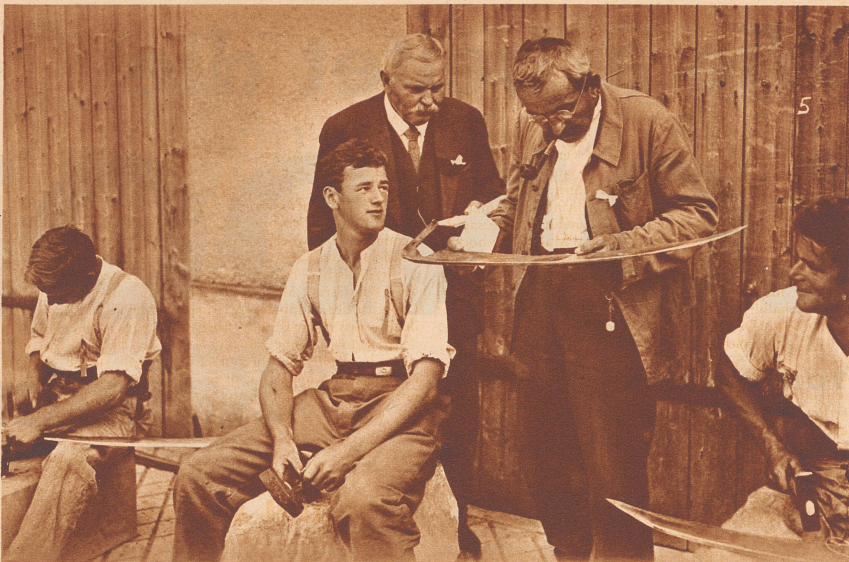
Das scharfe Auge des Preisrichters

Am Zähni ha-n-i my Glas ustrunge-n-und bi mit ere Nummere vo der «Neie Zirizytig», wo-n-i z'midag kauft gha ha, haim. Im Bett ha-n-i si no gläse, wil i gmaint