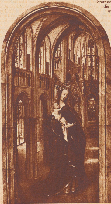
Der van Eyck für 30 Rappen

In Belgien vollzog sich vor einiger Zeit das jüngste Gaunerstück auf dem Gebiete der berühmten Bilderdiebstähle. In der Kathedrale von St. Bavo in Gent wurde am 11. April ein Flügel des berühmten Altargemäldes des van Eyck von bis jetzt unbekannt gebliebener Täterschaft geraubt. Es handelt sich dabei um ein Flügelstück des großen Altarwerkes, das auf der Seite die gemalte Statue Johannes des Täufers, auf der Rückseite die Gruppe der Gerechten Richter trägt. Der Kunsthandel, in den auf unbegreifliche Weise große Teile des Genter Altars gekommen waren, hatte die Flügel sorgsam zersägt, so daß der Johannes und die Gerechten Richter als Tafeln für sich dastanden. So kamen sie nach Berlin und waren dort im Kaiser-Friedrich-Museum ausgestellt. Bei Friedensschluß nach dem großen Kriege kehrten die beiden Bilder als Kriegstribut nach Belgien zurück. In der Kathedrale von Gent setzte man das einst Auseinandergesägte wieder zusammen, um den Altar wieder so in Ordnung zu bringen, wie er einst aus der Werkstatt Jan van Eycks hervorgegangen war. So kam es, daß die Diebe gleich zwei Bilder miteinander entwenden konnten. Trotz minutiöser Nachforschungen der internationalen Polizei konnte bis jetzt nicht die winzigste Andeutung von einer Spur der Räuber entdeckt werden. Was der oder die Uebelthäter mit dem Raube anfangen wollen, ist allerdings schwer begrifflich.