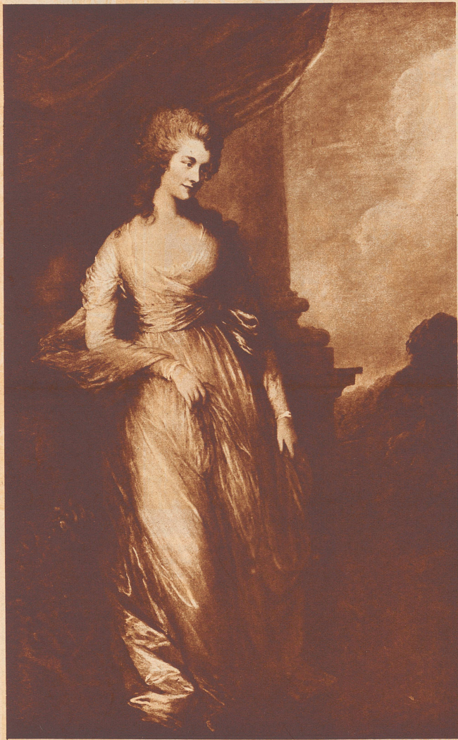
Die Entführung der Herzogin von Devonshire

Vor kurzer Zeit wurde in der Kathedrale von St. Bavo in Gent ein Flügel des berühmten Altarwerkes von Jan van Eyck gestohlen. Die geraubten zwei Bilder gehören zu den wertvollsten Kunstwerken der Welt. Der Diebstahl ist einer jener sensationellen, ans Unwahrscheinliche grenzenden Vorfälle, die jeweils nicht nur Kunsthandel, Museen und Künstler, sondern die halbe Welt erregen. Es ist schwer, sich eine Vorstellung von den Motiven der Diebe zu machen, da ja Kunstwerke von solcher Bedeutung und so hohem Wert in der ganzen Welt unverkäuflich sind. Dennoch ist es im Laufe der Zeit wiederholt vorgekommen, daß berühmte Gemälde geraubt – aber später, oft nach jahrelangen Irrfahrten, wieder aufgefunden wurden.