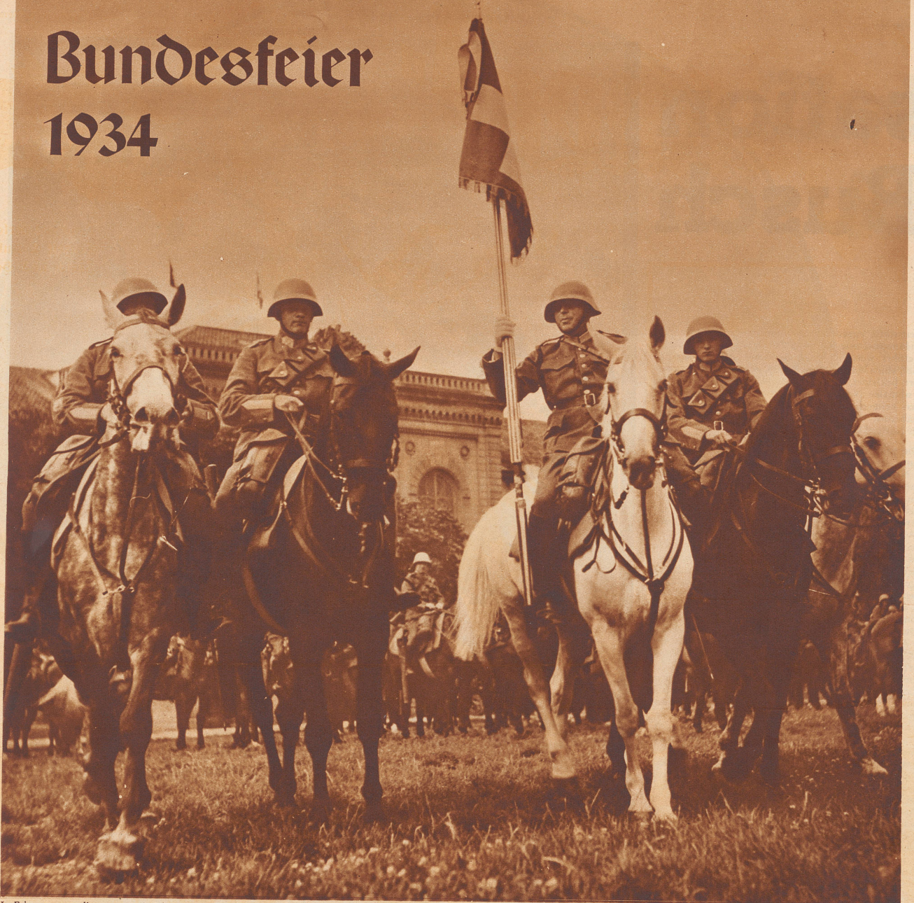
In Erinnerung an die vor zwanzig Jahren erfolgte Mobilmachung der gesamten Armee wurde überall im Schweizerland der diesjährige Nationalfeiertag in besonderer Weise begangen. In Zürich gipfelte die Feier in einem Zug des Militärs – Infanterie und Kavallerie – durch die Stadt und einer großen patriotischen Kundgebung auf dem alten Tönhalleareal. Bild: Die Uebergabe einer Kavallerie-Regimentsstandarte im Kasernenhof, auf dem selben Platz, wo 1914 die Truppen vereidigt wurden.