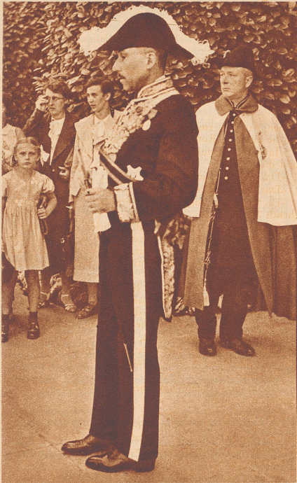
Graf Louis d'Ursel, Gesandter von Belgien