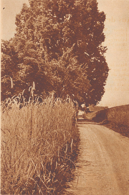
Eine Aufnahme kann nur Formen und Tönungen zeigen, den satten Glanz der goldenen Aehrenfelder, das Blau des Himmels und das innige Grün der Linden können nur Wanderer dort oben auf dem Ballenbühl genießen.