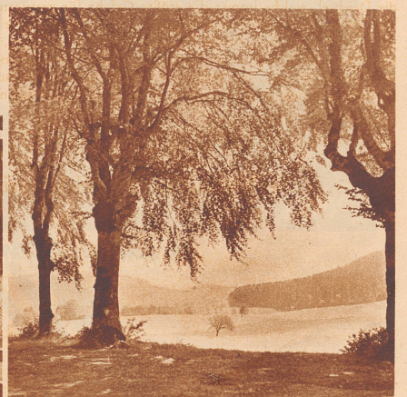
Wer dächte, daß diese rauschenden Buchen, inmitten einer sonnenstrahlenden Landschaft, den früheren Richtplatz des Landgerichts Konolfingen umrahmen!