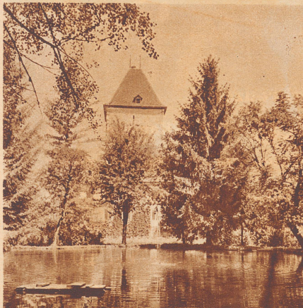
Um den mächtigen Wachturm liegt ein friedlicher, gutgepflegter Garten, dessen verschlungene Pfade in eine prächtige Allee münden.

Anschlüsse: Route 25 nach Großhöchstetten; 45 Min. und Route 24 nach Biglen; 1 1/2 Std.