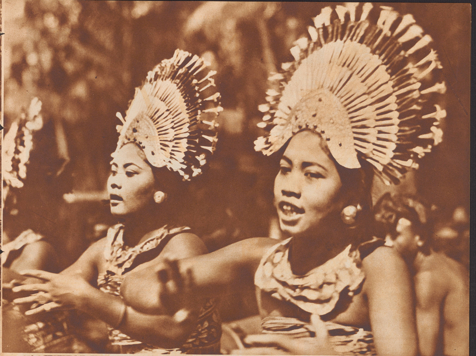
Der kunstvolle Kopfschmuck der balinesischen Tänzerinnen.