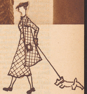
Ein vornehm wirkendes Besuchs- kleid aus braunem Jersey, mit großen, grünen Holzknöpfen.