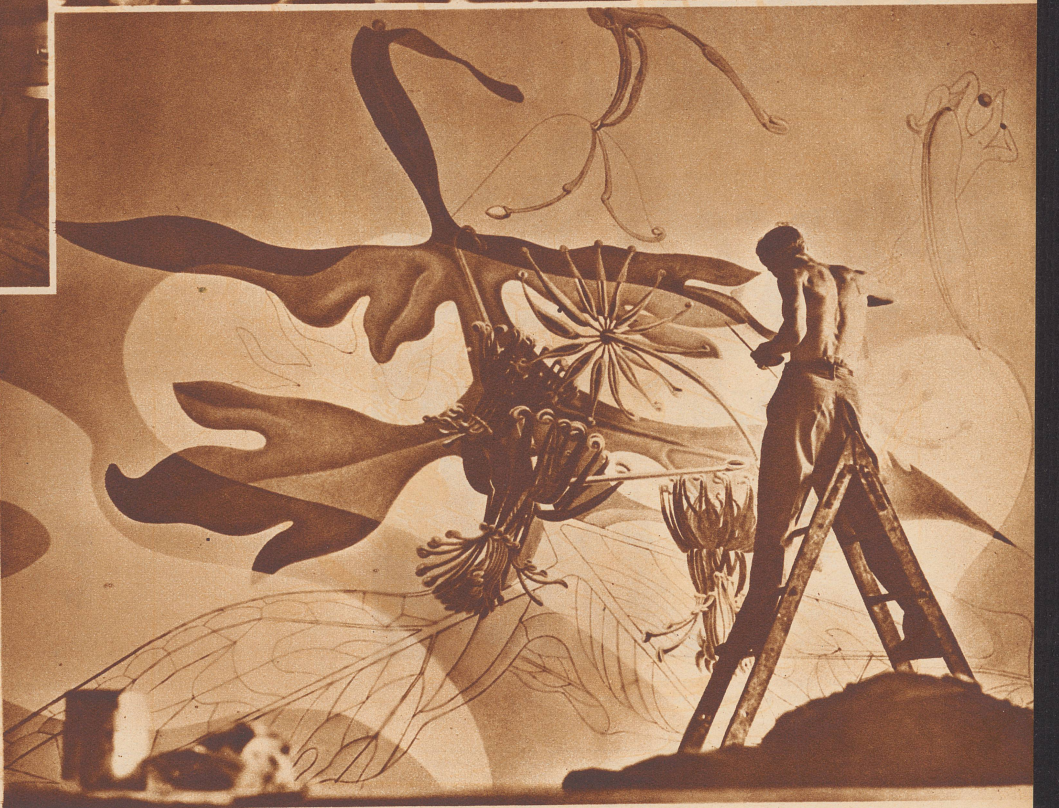
Die Wände der neuen Corso-Bar sind mit Fresken, Arbeiten des Kunstmalers Paul Ernst, geschmückt.

Das Zürcher Corso-Theater hat, nachdem es während langen Monaten wegen Umbaarbei- ten geschlossen war, seine Pforten wieder ge- öffnet. Was dem sich zahlreich einfindenden Publikum an künstlerischen, architektoni- schen und technischen Neuerungen vorgeführt wird, rechtfertigt die lange Schließung des be- liebten, volkstümlichen Theaters. Das Corso hat zwar äußerlich seine fröhlich verschnör- kelte Fassade behalten. In seinem Innern aber sind die kunstvoll geschwungenen, mit Stuck- werk und roten Samtvorhängen verzierten Logen und Türen verschwunden. Verschwun- den sind die korinthischen Säulen. Die etwas muffig romantisch anmutenden Räume wur- den von geschickten Architekten in Säle ver- wandelt, welche in ihrer bühnentechnischen, künstlerischen und hygienischen Ausstattung den neuesten Anforderungen entsprechen.