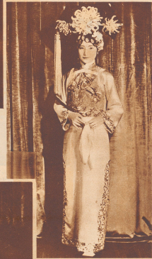
Eine mandarinische Prinzessin in ihrem prunkvollen Hauskleid.