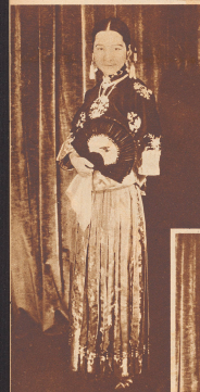
Ein chinesisches Hochsteckkleid, wie es zu Beginn des 20. Jahrhunderts von vornehmen Chinesinnen getragen wurde.