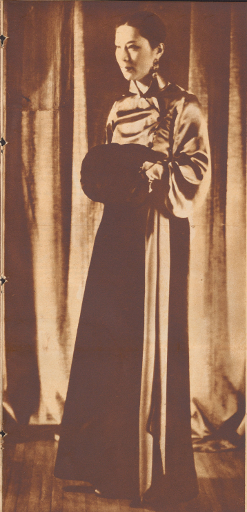
Ein modernes Abendkleid, das die Chinesen überaus elegant zu tragen verstehen, wie sie es einmal den Kinostern trug.