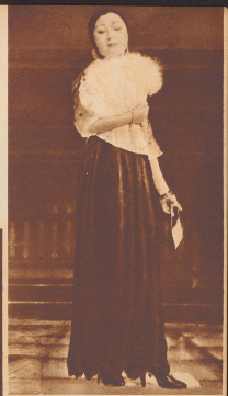
Die große Einflügel der europäischen Mode hat sich schon vor fünf Jahren bemerkbar gemacht.