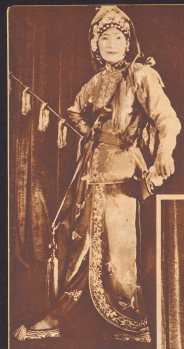
Eine chinesische Jeanne d'Arc. Man sah, so hieß die junge Mädchen, kämpfte während einiger Jahren an Stelle ihres erkrankten Vaters gegen die Mongolen.