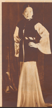
Eine glückliche Kombination zwischen einem modernen europäischen Abendkleid und dem chinesischen Kostüm.

Noch vor zehn Jahren sah man in China ausschließlich die Nationaltracht, die heute nun durch europäische Modeneinflüsse fast völlig verdrängt ist.