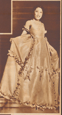
Das erste fremdländische Abendkleid, das im Jahre 1923 in China zu sehen war, es bestand aus europäischen Stoffen und war eine ganz bequeme Rockwebe auf.