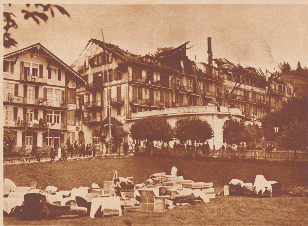
Der Hotelbrand auf Beatenberg. Am 11. September brach anscheinend infolge Kurzschluss in dem bekannten Regina-Palace-Hotel auf Beatenberg ein Brand aus, dem die oberen Stockwerke des Hauses zum Opfer fielen. Der entstandene Feuer- und Wasserschaden beläuft sich auf rund 400 000 Franken.

Die «Nationale Tatgemeinschaft» lieferte 77 500 Unterschriften für das Volksbegehren nach einer Totalrevision der Schweizerischen Bundesverfassung im Bundeshaus ab. Von rechts nach links: der Vertreter der «Neuen Schweiz» mit rund 6500 Unterschriften; der Vertreter der Jungkonservativen mit rund 27 500 Unterschriften; der Verbindungsmann zwischen den vier Bewegungen der «Tatgemeinschaft», Vogel; der Vertreter der «Nationalen Front» mit rund 34 500 Unterschriften; der Vertreter der Landesgemeinschaft «Das Aufgebot» mit rund 9000 Unterschriften.