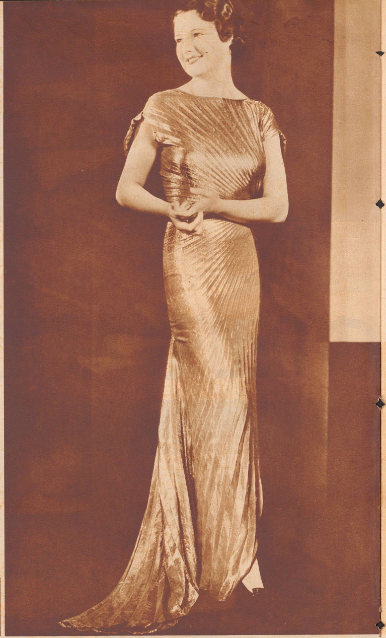
Elegantes Abendkleid aus grün- goldener Lamé, ganz in Plissé- Soleil ausgeführt. Modell Grieder