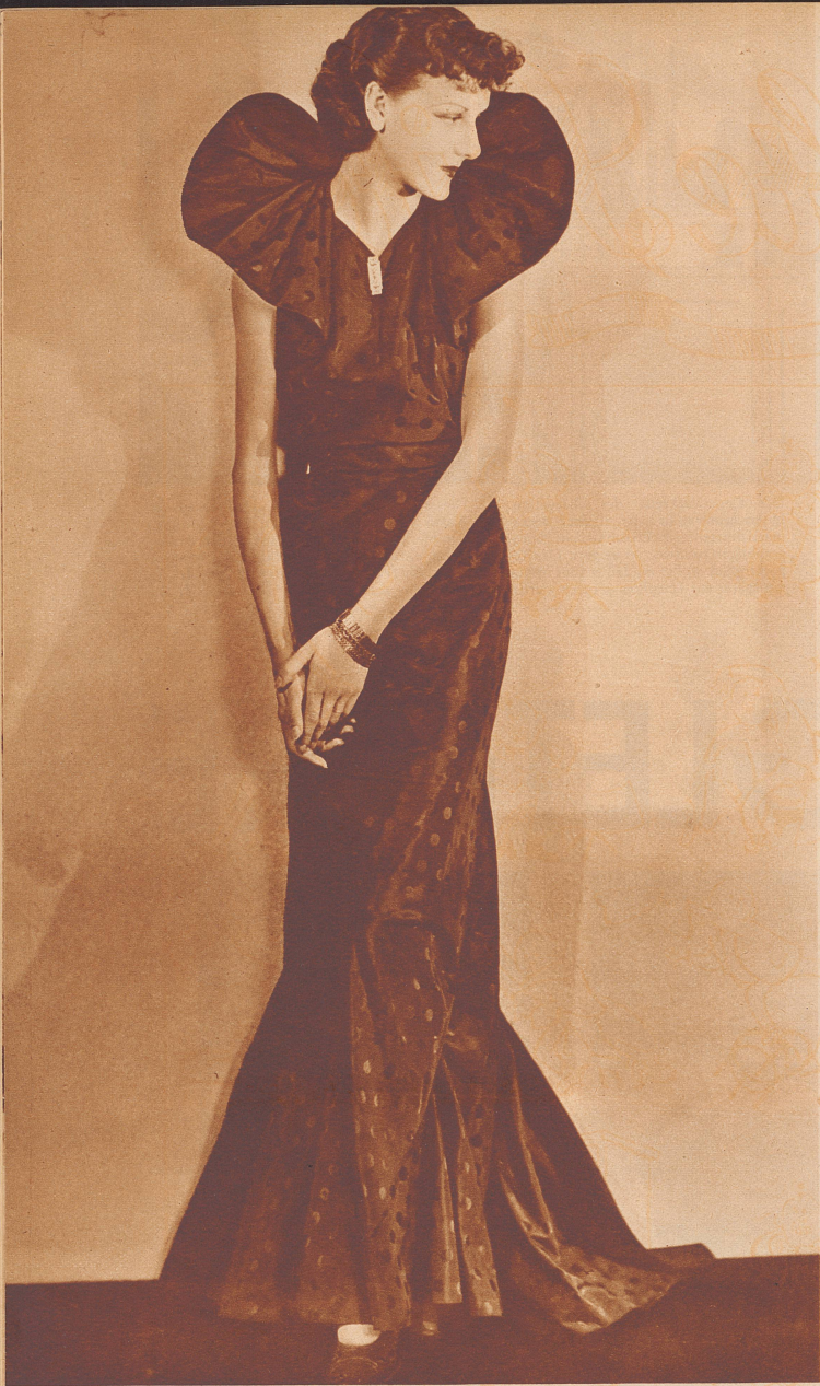
Schwarzes Abendkleid aus getupftem Taffet. Modell Grieder