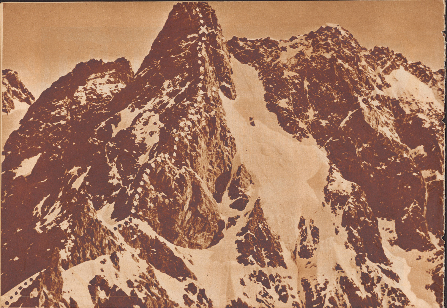
Der Mischirgi-Tau mit der Aufstiegroute über den Südgrat und die Stelle des Biwaks (X) auf 4700 Meter Höhe.