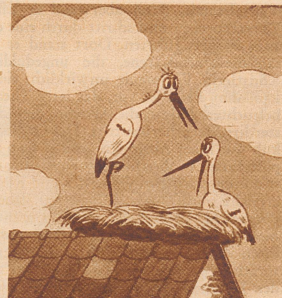
«Du mit deinem ewigen Süden.» «Dieses Jahr mache ich eine Nordlandreise!»