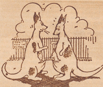
«Fürchtbar! Hast du gehört, hier soll es Taschendiebe geben.»