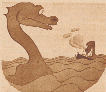
Lochness. «Was muß deine Mutter sehen? du rauchst?» H. J.

«Verzeihung, mein Herr, aber Sie sitzen auf meinem Hut!» «Wollen Sie wirklich schon gehen?»