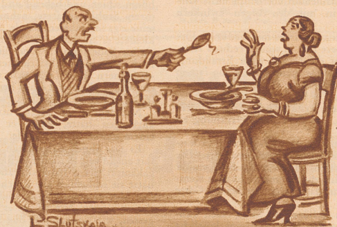
Die Zeiten ändern sich.

«Als wir verlobt waren, Richard, sagtest du immer, daß du mich vor Freude aufessen könntest und jetzt wirst du wütend, wenn du nur ein Haar von mir in der Suppe findest.»