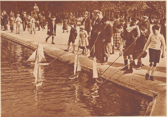
Der Start der Segelschiffe. Könnt ihr die langen Stangen, mit denen die Schiffchen ins Wasser gestoßen werden, erkennen?