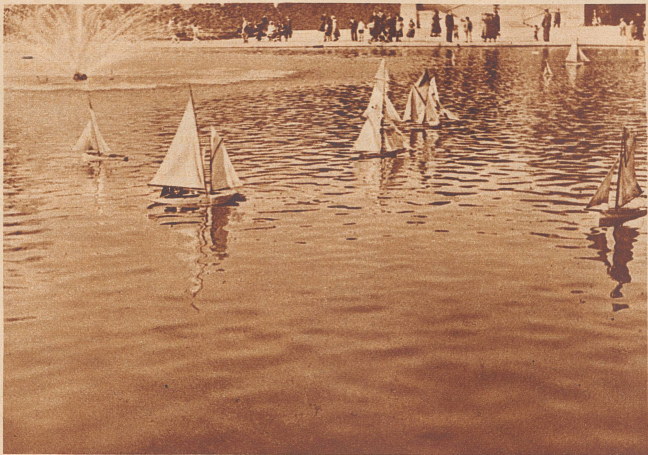
In voller Fahrt. Welcher Segler wird wohl zuerst am andern Ufer sein?