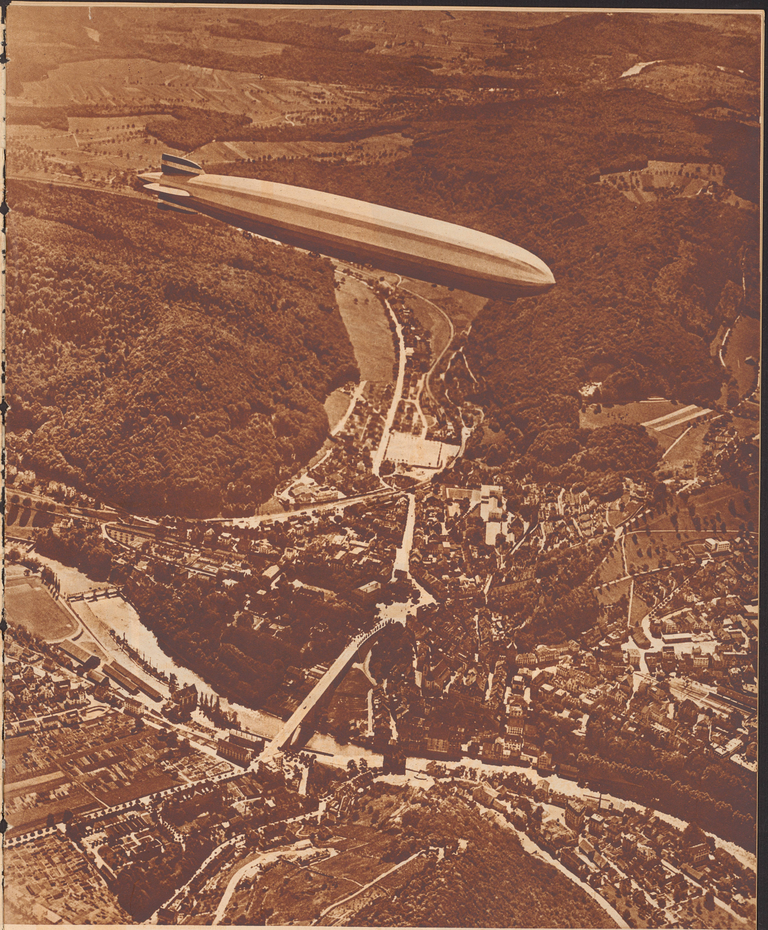
«Graf Zeppelin» über dem aargauischen Städtchen Baden