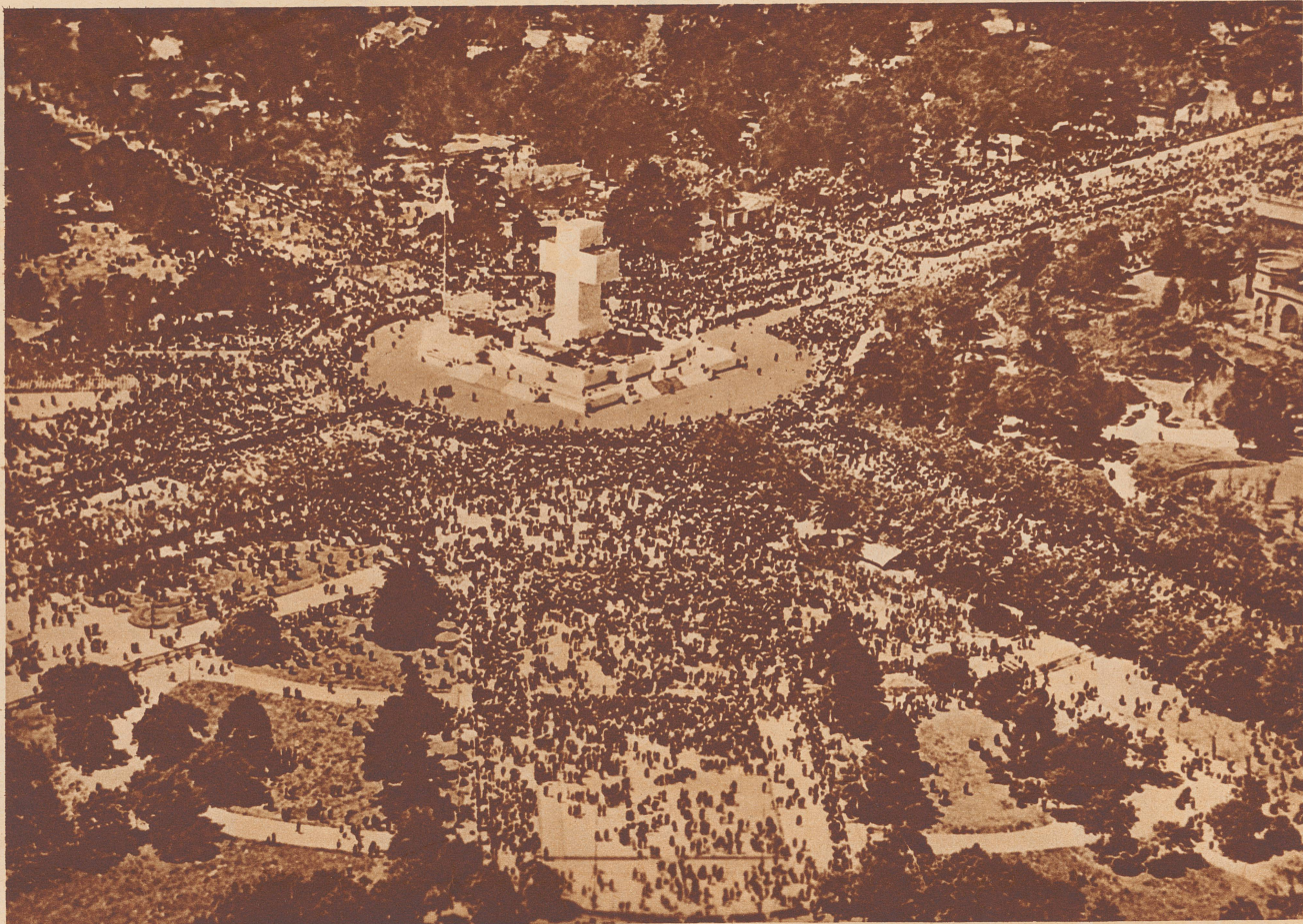
Der eucharistische Kongress in Buenos Aires. Blick in den Palermopark bei Buenos Aires, dem Versammlungsort der Besucher. Mehr als eine Million Menschen wohnten der Messe bei, die Kardinal Pacelli bei dem im Park errichteten Riesenkreuz zelebrierte.