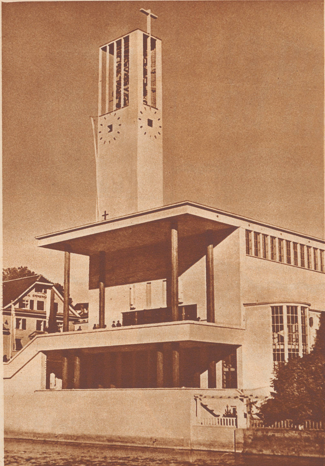
Die neue katholische Kirche zu St. Karl in Luzern. Architekt: Fritz Metzger.