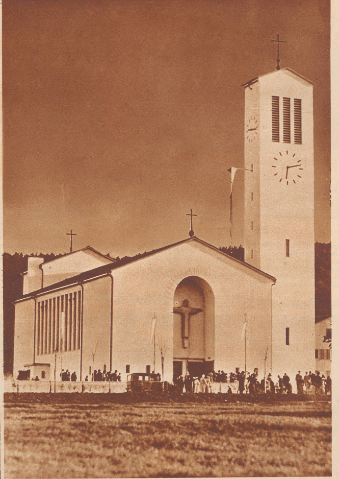
Die neue katholische Herz-Jesu-Kirche in Winterthur. Architekt: Kaczorowski. Die Plastik über dem Eingang ist eine Arbeit des Bildhauers Ed. Bick.