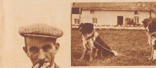
Schäferhunde und ihr Meister. Der Stock des Schäfers allein schon genügt, die Hunde am Platze festzuhalten.