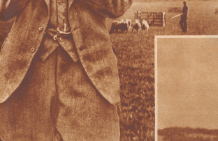
Bei der Hirtenhundprüfung darf der Schäfer sich mit seinem Hunde nur durch Pfiffe verändern. Muß er ihn aufrufen, so heißt das, daß die Ausbildung des Hundes nicht vollkommen ist, und das gibt Strafpunkte.