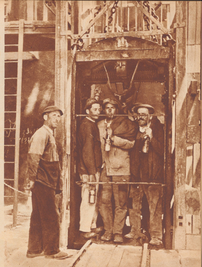
Einfahrt in den Schacht San Agustin. In fünf Minuten Fahrt hält der Förderkorb 372 Meter unter der Erde. So tief ist man bis jetzt in Almadén in die Tiefe gedrungen. Noch immer, wie vor 500 Jahren, ist die Erprobung dieselbe. Zwischen werden Blöcke gefördert, die 34,5 Quecksilber enthalten.

Einmal in einer Chemierunde, da haben wir es gelernt: das Quecksilber ist das einzige bei gewöhnlicher Temperatur flüssige Metall. Und wir haben auch erfahren, wo das Quecksilber zu allen Zeiten gewonnen wurde, wenn es einer Verwendung fand und heute noch findet. Wenn glatte Damen verwenden Verhüllten, das Quecksilberoxyd, als Schminke. Mit Quecksilber vermischt die Landkutsche des Mittelalters ihre Füllstoffe. Man sollte heute man von allen her mit Quecksilberstrahlen, die sie zu Hüten gefordert wurden. Nicht nur die Quecksilber verordneten Quecksilber gegen alle inneren Schlingen des Menschen, auch in der richtiggebunden Medizin wird das Metall eine bedeutende Rolle. Viele Farben, vorsehlich der sub-marine-Schiffsfarben, tragen nicht, wenn sie nicht Quecksilber enthalten. Seit ihrer Erfindung wurden die Glasrohre der Thermo-, Baro- und Messinstrumente mit Quecksilber gefüllt, die Spiegel mit ihm belegt. Heute ist das Metall einer der wichtigsten Rohstoffe der Kriegswirtschaft. Es bildet in Form von Knallquecksilber den unerlöschlichen Zündstoff für Geschosse jeder Art, von der Gewehrpatrone bis zur schwersten Granate, von der Flugbombe bis zum Torpede. — Das Wort Almadén kommt aus dem Arabischen und bedeutet Grab (Al Madra — die Grube). Aber beim Hören des Namens wissen wir es ist die älteste und reichste Quecksilbermine der Erde. Jahrhundertlang war Almadén das Quecksilberland für jedermann, der davon bedurfte. Nur im österreichischen Liria und im