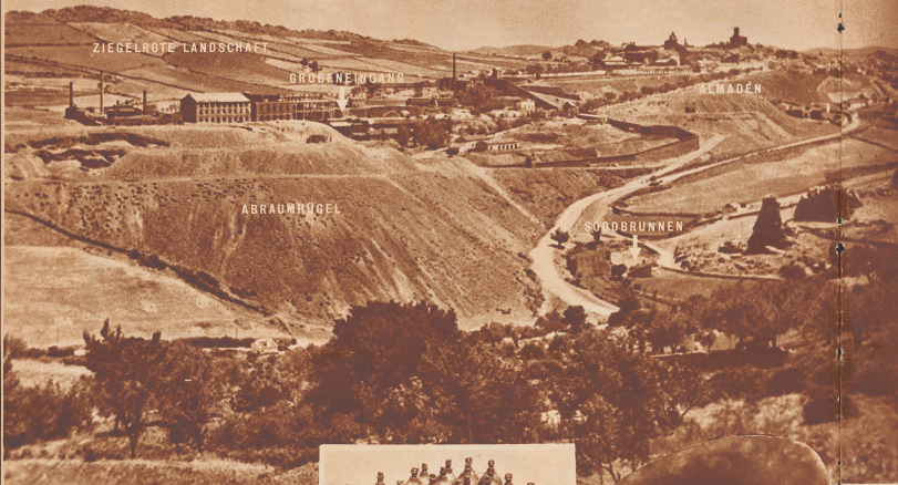
Blick auf die seltene und reine Quecksilbermine der Erde Almadén. Der Ort liegt an der großen Bahnhofs-Madrid-Sevilla-Gebirge auf der ausgetrockneten, zugefrorenen kanarischen Hochebene. Im Mittelgrund die riesigen Abraumhügel, die im Laufe der Jahrhunderte zu kleinen Bergen angewachsen sind. Dorthin die Werkzeuge, die besetzt aus der Förderanlage, acht Schmelzöfen von denen jeder drei Mann eine ehemalige Direktion oder Verwaltungsstelle trägt, Kondensationskammern und den Magazinen. Im Hintergrund das Städtchen Almadén. Es zählt rund 10.000 Einwohner.