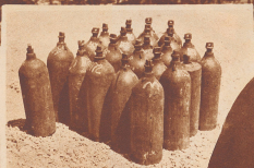
In diesen Stundentafeln mit 34,5 kg Inhalt gelangt das Quecksilber auf den Markt.