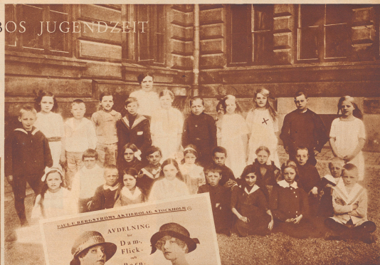
Greta Garbo und ihre Schulkameraden. In der obersten Reihe die dritte von rechts ist Greta Gustafsson.

fung er an, Bilder von ihr zu sammeln, nicht aus dem Film, sondern aus ihrer Jugend- und Kinderzeit, Photographien, die er mühsam und oft mit unglücklicher Frivolität aufzutreiben wußte. Er wandte sich an das Warenhaus Bergström, blätterte alte Kataloge durch, worin die Garbo abgebildet war, verschaffte sich Empfehlungen, um damit bei dem früheren Arbeitgeber der Garbo, bei ihren Lehrern und Mitschülern Eingang zu finden und überall seinen Wunsch nach Bildern abzugeben zu können. Unser Gewährsmann läßt sich die Sammlung zeigen, photographiert eine Anzahl der sel-