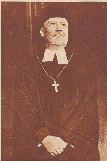
Der Landesbischof von Württemberg, Oberkirchenrat Wurm.