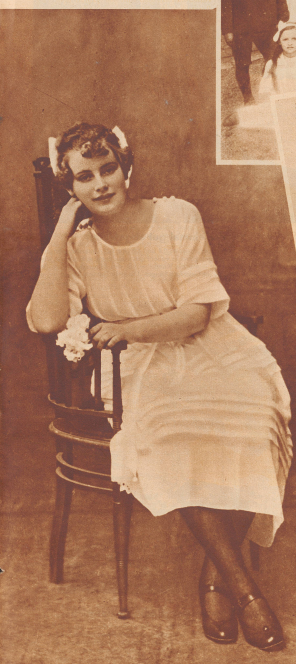
Greta Garbo als Konfirmandin.