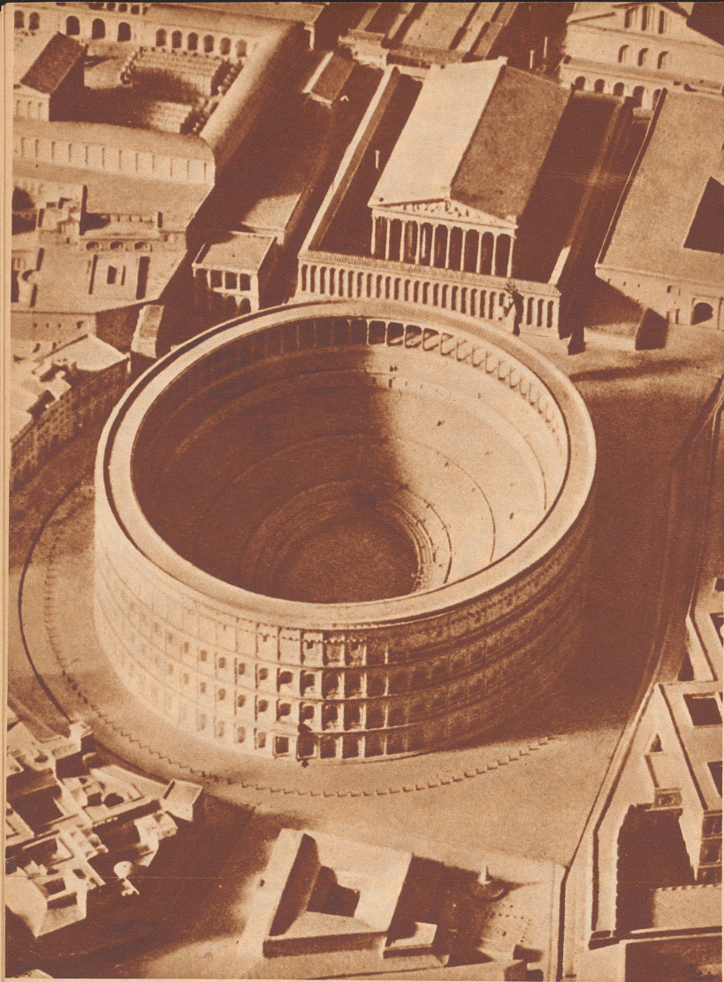
Das flavische Amphitheater, in späterer Zeit nach dem daneben befindlichen «kolossalen» Standbild des Nero das Colosseum genannt. In diesem gewaltigen steinernen Zirkus, der 40 000 Besucher faßte, fanden die berühmten Tierhetzen und Gladiatorenkämpfe statt. Hier erlitten auch unzählige Christen den Märtyrertod. Die Sitzreihen konnten durch riesige Segel gegen die Sonnenhitze geschützt werden. Matrosen aus der kaiserlichen Marine versahen den Dienst der Segelspanner.

den guten Geschmack. Siehst du hier links auf dem kapitolinischen Hügel den alten Jupitertempel, unser Staatsheiligtum seit den Zeiten der Republik, doch darunter die Höhle ist die Weihestelle des Mithras, des persischen Gottes. Drüben rechts auf dem Palatin liegt der Kaiserpalast des großen Augustus, aber der Tempel davor ist der syrischen Göttin geweiht, der Astarte und Astroarche, wie sie sie nennen. Da hast du ein deutliches Bild, wie sich das Fremde in Rom eingefressen hat und alles Römische überwuchert. — Hier ist die Kneipe. Du wirst froh sein, dem Gewühl zu enttrinnen. Es gibt ausgezeichnete Artischockenböden, in Oel gebacken, und Hammel vom Spieß nach ägyptischer Art.