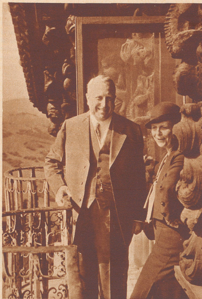
Der Zeitungskönig Hearst

Zu Hearst in die Schule gingen der Schöpfer der englischen gelben Presse, Lord Northcliffe und sein Bruder,