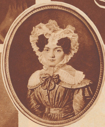
Die Mutter des Obersten, eine geborene de Courten.