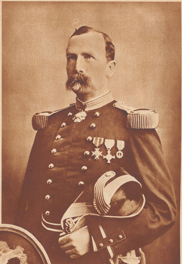
Der Kommandant der Schweizergarde, Oberst Louis de Courten, im Jahre 1888.