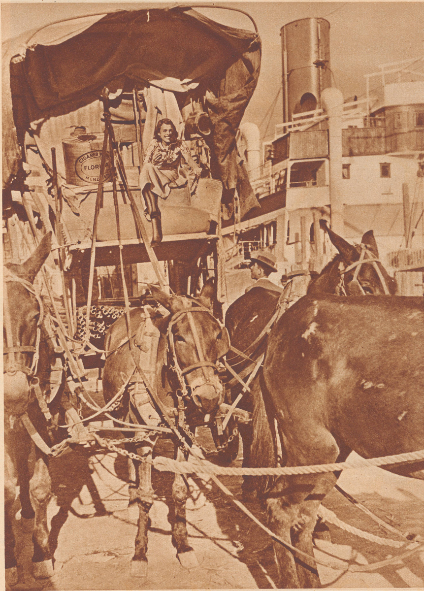
Der Ozeandampfer und die Maultierpost treffen sich am Quai von St. Cruz auf Teneriffa.