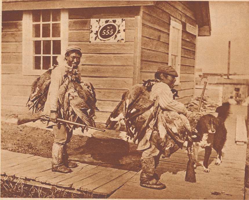
Junge Grönländer kehren von einer glücklichen Jagd zurück.

durch goldumranderte Brille, streicht seinen Bart und meint: «Wir wollen uns über Elektrizität unterhalten!!» Zwölftausend Blitze fahren in Kulik hinein. Es verschlägt ihm den Atem. Der freundliche Herr merkt es und wendet sich an den zu Tode Erschrockenen: «Um Ihnen die Angst zu nehmen, wollen wir gerade bei Ihnen anfangen.»