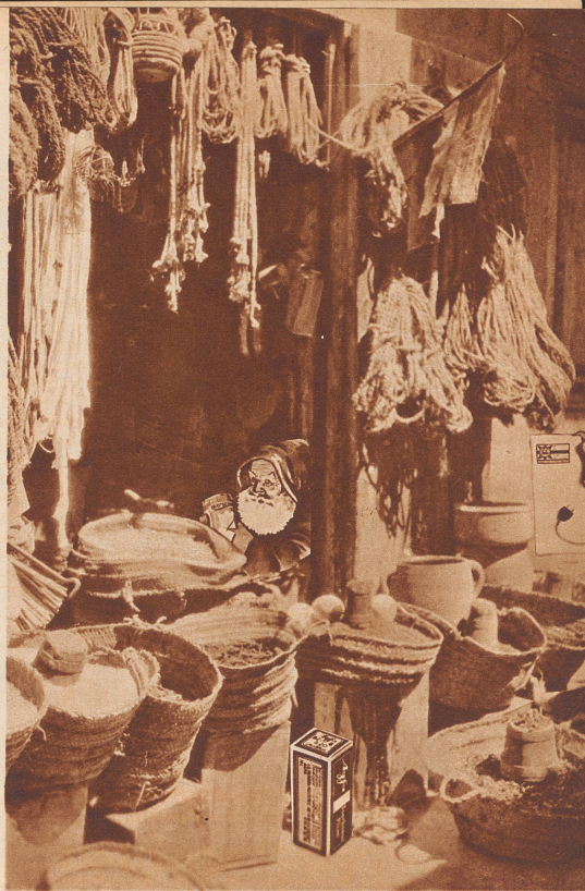
Arabischer Laden in Tripoli.

In schlecht verhehlter Aufregung betrat Pietro zu ungewöhnlicher Stunde den Saal und hielt gerade auf mich