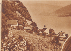
Im Nebel von Quinten. Die Quintener machen sich nicht sehr viel aus dem See. Sie steigen nicht hinaus, um zu baden oder zu schwimmen. Als Quintener, die sich im Malerigen Quintener-Wein verwehnt haben, seien gelegentlich auf dem Heimweg im Wasser gefallen. Doch sei noch nie einer ertrunken. Darauf ist man sehr stolz.

Die älteren Mädchen des Dorfes ziehen meist in die «Ferne», das heißt in die übrige Schweiz, weit weg von ihrer Robinsoninsel. Auch die jungen Männer sind selten. Einer der Zurückgebliebenen vererbt den Boosen-