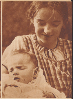
Hedwig mit der jüngsten Quintenerin, dem Kobi.