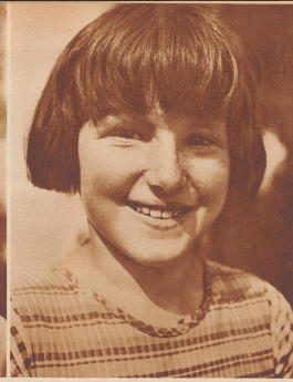
Romane vertritt, daß man die Quintener nicht etwa «Küchler» nenne wegen ihres Charakters.