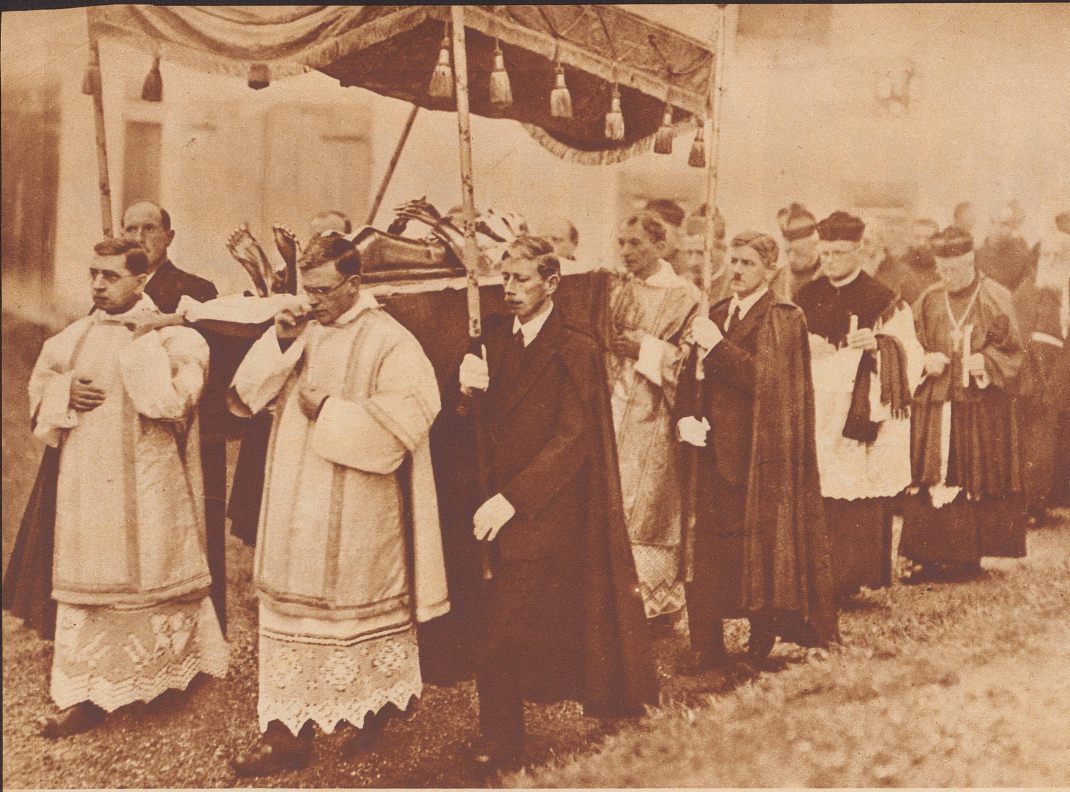
Die Bruderklausen-Statue auf dem Wege in die Pfarrkirche von Sachseln