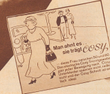
Ein drittes Beispiel: Das junge Mädchen mit dem kräftigen Beinchen. Die gezeichneten Zouschens, die da etwas unvermittelt dazukommen, man ... die kennen Sie doch, das sind die Herrschaften vom Cozy-Schokolade. Es ist in Ihnen eine derartige Entdeckung, dann schreiben Sie auf und senden sie weiter.