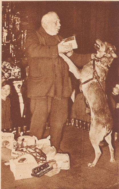
Das Christkind für die Blindenhunde.

Der Berliner Tierschutzverein organisiert jedes Jahr eine Weihnachtsbescherung für die Blindenhunde von Berlin. Mit Futter, warmen Decken und Hundekuchen werden die vierbeinigen Freunde und Führer der Kriegsblinden beschenkt. Unser Bild zeigt so eine Bescherung im Berliner Landesausstellungspark.