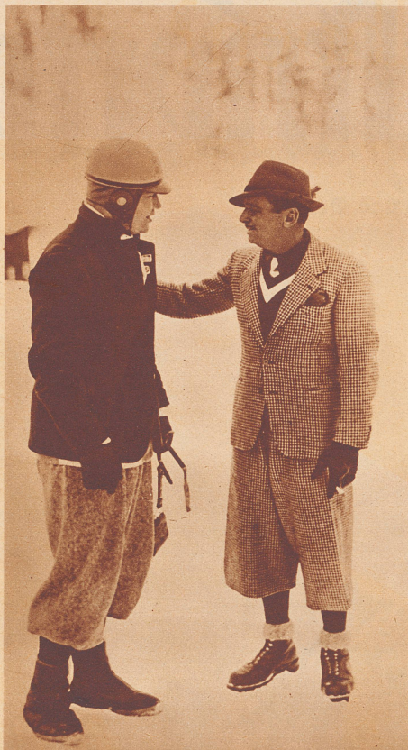
Douglas Fairbanks, der Held vieler schöner Filme und Geschichten, treibt zur Zeit in St. Moritz Wintersport.