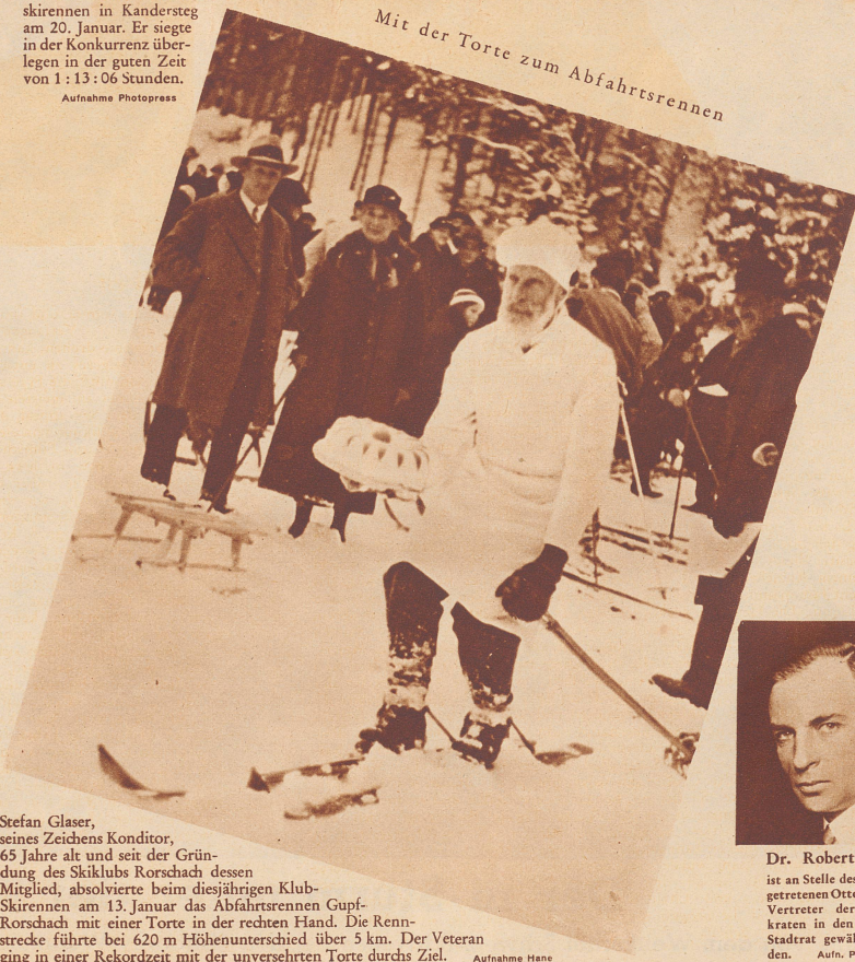
Mit der Torte zum Abfahrtsrennen