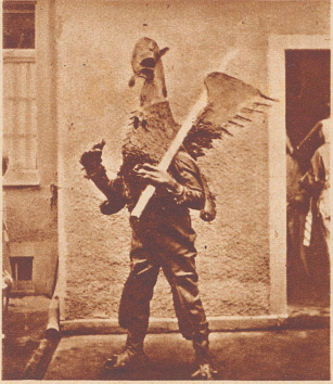
Der Vogel «Gryff», wie er durch Kleinbasels Straßen zieht . . .