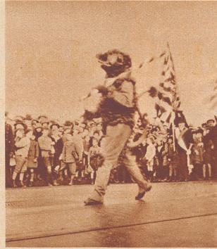
Der Wappenhalter der Gesellschaft zum «Rebhaus», der Löwe . . .