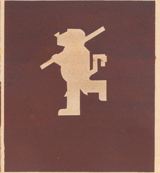
. . . und der Scherenschnitt des Wappentiers.