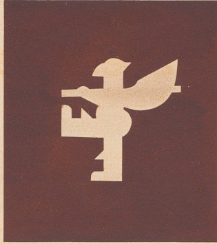
. . . und wie ihn die Schüler als Scherenschnitt wiedergaben.