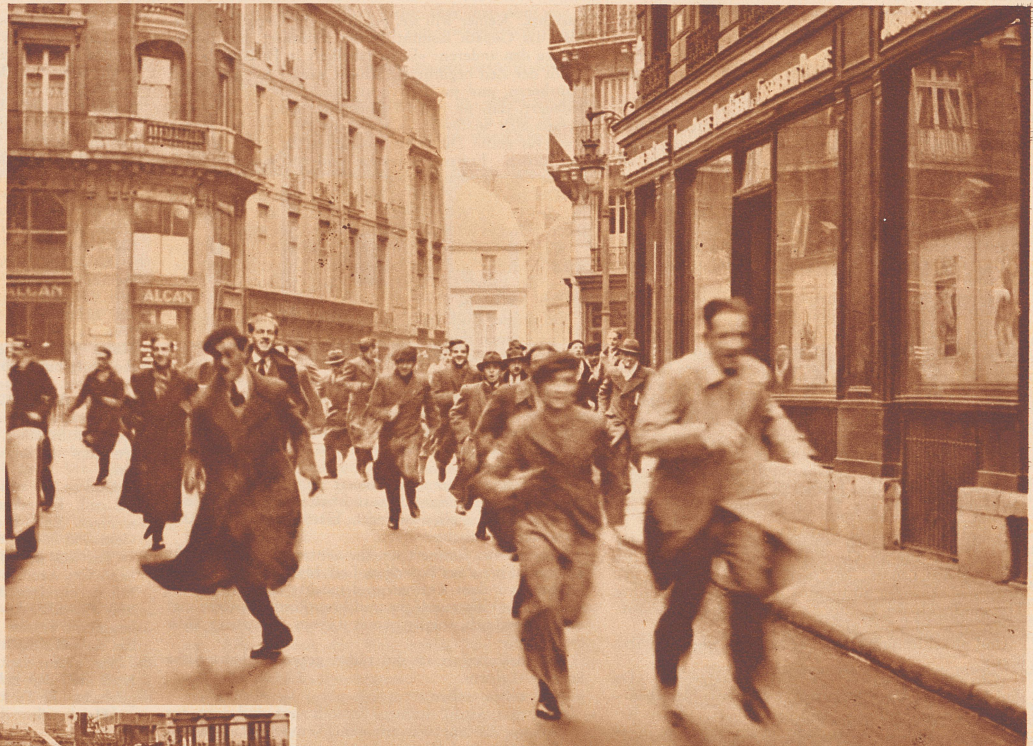
Protestkundgebungen französischer Medizinstudenten. Die französischen Medizinstudenten greifen zum Selbstschutz. Ein Gesetz aus dem Jahre 1933 gestattet auch den ausländischen Medizinern die Erwerbung des Arztdiploms. Damit verringern sich die Erwerbsmöglichkeiten für die Einheimischen, und da gerade jetzt wieder im Zusammenhang mit den Vorkommnissen in der Saar eine Einwanderungswelle sich fühlbar machte, traten an verschiedenen Orten die medizinischen Fakultäten, zunächst diejenige der Universität von Montpellier, in den Streik. In öffentlichen Kundgebungen verlangen sie behördlichen Schutz vor der drohenden Einwanderer- und Ausländerkonkurrenz. Bild: Pariser Medizinstudenten auf der Flucht vor der Polizei, die sie an Kundgebungen im Quartier Latin zu verhindern sucht.