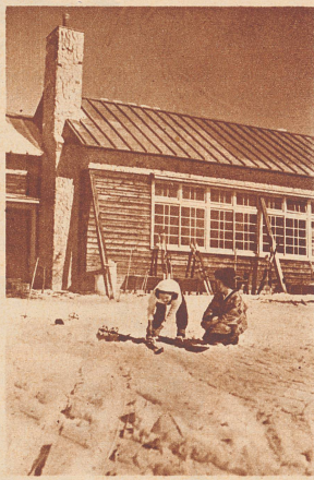
Vor der Skihütte: die alte und die neue Welt. Japanerin in alter Tracht und Strohsandalen bedient im Schnee eine junge, emanzipierte Skiläuferin.