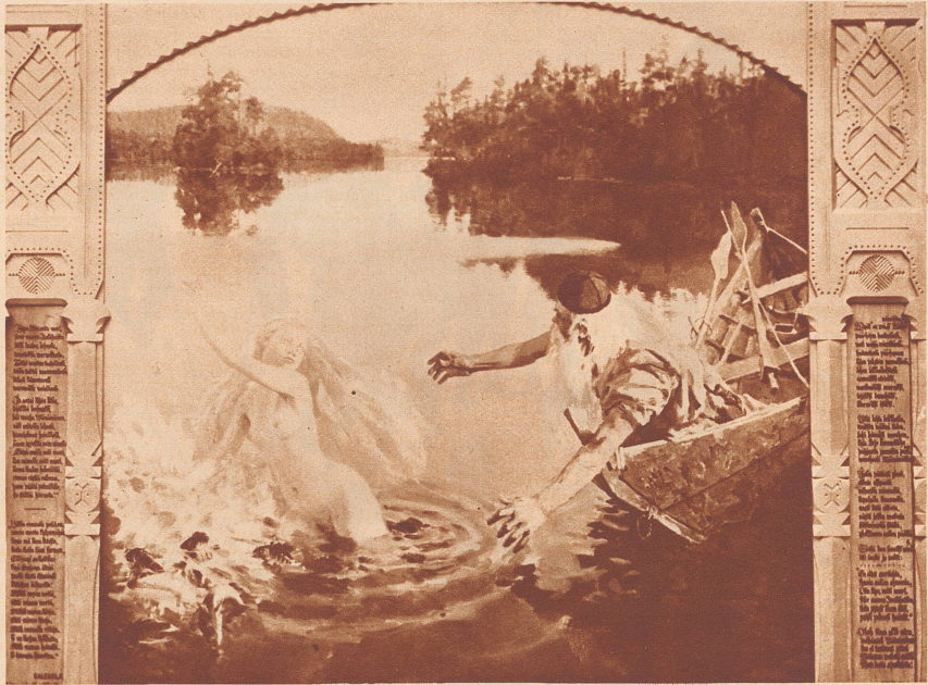
Die junge Aino flieht vor Wäinämöiner. Gemälde von Akseli Gallen-Kallela.

In Helsingfors fand am 28. Februar eine große Feier zur Erinnerung an die Schaffung des finnländischen National-Epos Kalevala statt. Die Heimat Kalevalas ist das östliche Finnland, Karelén. Dort machte Elias Lönnrot, der Sohn eines armen Dorfschneiders (1802-1884), seine Sammelfahrten, dort zeichnete er die Lieder auf, von denen hunderttausend Varianten in der Sammlung der Finnischen Literaturgesellschaft zu finden sind. Im Laufe der Sammlerarbeit erkannte Elias Lönnrot einen gewissen innern Zusammenhang der von ihm gesammelten Lieder. Auf diese Erkenntnis gestützt, baute er das finnische Volksepos auf in der Form, in der wir es heute besitzen, nicht nur als kulturelles Gut eines Volkes, sondern als ein wertvoller Schatz der Volksdichtung überhaupt. Kalevala ist für das finnische Volk unerschöpflicher Born zur Bereicherung seiner Sprache geworden. Das Epos hat seinen Namen nach einem in dem Gedicht vorkommenden Volk, inhaltlich greift es weit zurück in die heidnische Zeit. Das ganze besteht aus 52 Runen mit nahezu 23 000 Versen, die von den Runensängern gesungen wurden. Die zentrale Gestalt Kalevalas ist der alte Wäinämöinen. Um ihn scharen sich die übrigen Helden. Nicht zu unterschätzen ist auch die Bedeutung Kalevalas sowohl für die finnische Tonkunst, wie für die bildenden Künste. A. B. m.