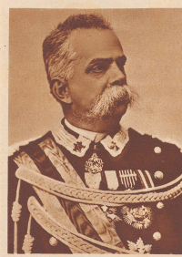
Der Herrscher von Italien 1896: König Umberto I. Er wurde 1844 geboren, regierte von 1878 bis 1900, in welchem Jahre er in Monza von Anarchisten Bracci unüblich einem Versteck erschossen wurde.

Menelik II. Im Herbst desselben Jahres wurde Menelik II. zum «König der Könige» proklamiert. Zwischen der Herrschaft Meneliks I. und Meneliks II. liegt ein Zeitraum von rund 2900 Jahren. Menelik I. Sohn des Königs Salomon und der äthiopischen Königin von Saba, folgte seiner Mutter auf dem Thron von Saba im Jahre 986 vor Christi Geburt. — Menelik II. vererbte den Einfluß der Italiener, die sich an der Küste des Roten Meeres und tief ins Land hinein bereits sehr zahl festgesetzt hatten, auszuschalten. Es kam der Vertrag von Uccialini zustande. Dieser Freundschafts- und Handelsvertrag enthielt einen Artikel, wonach sich der König von Abessinien bei allen geschäftlichen Verhandlungen mit andern Mächten der italienischen Regierung bedienen würde. Menelik hatte bei der Abfassung dieses Artikels bedungen, aber bald mußte er erkennen, daß die Italiener daraus das Recht abzuleiten, über Abessinien ein Protektorat zu errichten. Er fand es für den Augenblick zwar nicht opportun, dem Italiener offenen Widerstand entgegenzusetzen, jedoch ging er daran, seine Armeen zu reorganisieren,