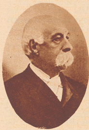
Francesco Crispi 1887 bis 1891 und 1893 bis 1896 italienischer Ministerpräsident. Crispi war ein Freund Bismarcks. Der Feldzug gegen Menelik war zum großen Teil sein Werk. Die Niederlage von Adua führte zu seinem Rücktritt, aber dieser afrikanische Mißerfolg verminderte nicht seine Popularität. Er starb am 11. August 1901 in Palermo, 82 Jahre alt.

die bisher auf rein feudaler Basis aufgebaut gewesen war. Meneliks Reform ging darauf hinaus, ein einigermaßen zentralisiertes stehendes Heer zu schaffen, das aus den Erträgen des Handelsmonopoles, die er einführte — Elfenbein, Häute, Kaffee, Kautschuk — finanziert wurde. Jeder Soldat der stehenden Armee Meneliks hatte ein Anrecht auf 10 Dollars Barbelohnung pro Jahr und auf sieben Handvoll Weizen monatlich. Die Offiziere bezogen bis 50 Dollars jährlich. Im Jahre 1893 fühlte sich Menelik stark genug, den Vertrag von Utschalli zu kündigen. Nun begann ein langwieriges Geplänkel. Aus dem Geplänkel erwuchs eine Spannung zwischen den beiden Ländern, die nach der Entscheidung durch Waffengewalt drängte. Im Spätsommer 1895 wurde in Rom der Beschluß gefaßt, mit Menelik ein für allemal abzurechnen, und gleich darauf rückten die Italiener von Norden her ins Land ein. General Oreste Baratieri, Gouverneur von Italienisch-Eritrea, konnte stolz nach Rom melden, er habe die ersten Bergketten im Norden überschritten und sei auf das Hochplateau von Tigré vorgedrungen. Unter wechselndem Glück entspann sich in dem sehr beschwerlichen Gelände ein blutiger Kleinkrieg bis zum Frühjahr 1896.