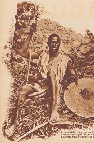
Ein abessinischer Krieger aus der Zeit des zämiändischen Völkerrauchs 1936. An Stelle der Feuerwaffe trägt er Schwert und Lanze.

DER ITALIENISCH-ABESSINISCHE KONFLIKT VOR 40 JAHREN