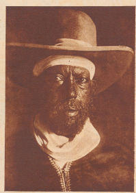
Der Herrscher über Abessinien: Kaiser Menelik II. zur Zeit des Sieges bei Adua. Menelik wurde im Jahre 1844 geboren. Er starb am 22. Dezember 1913.