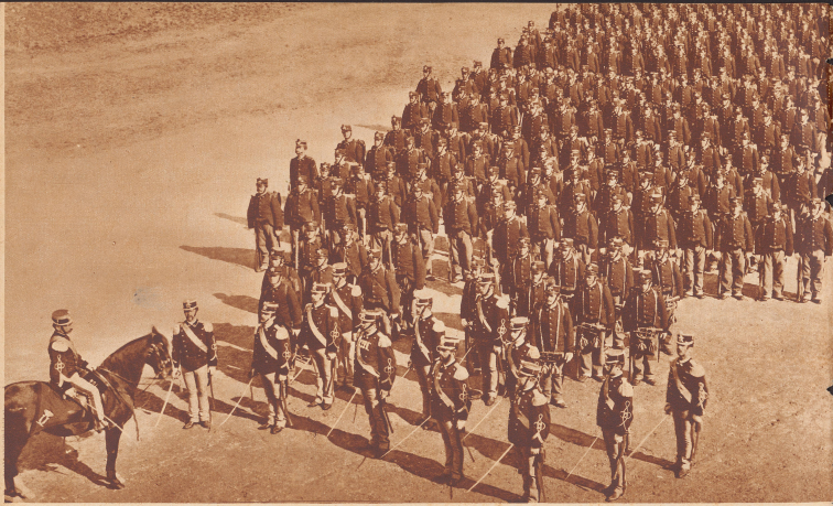
1895: Eine Kompagnie italienischer Infanterie, marschbereit zur Abreise nach Abessinien, um am Krieg gegen Menelik teilzunehmen. Die italienische Expeditionskorps streute sich zusammen aus 14 Bataillonen Infanterie, 2 Bataillonen Bersaglieri, einem Bataillon Alpen, 5 Feldbatterien, 4 Chekhabatterien, einer halben Kompagnie Genie und 5 Bataillonen eingeborener Fußtruppen. Zusammen 14.500 Mann mit 36 Geschützen. Das Expeditionskorps stand unter dem Oberbefehl des Gouverneurs von Eritrea, General Oreste Baratieri.