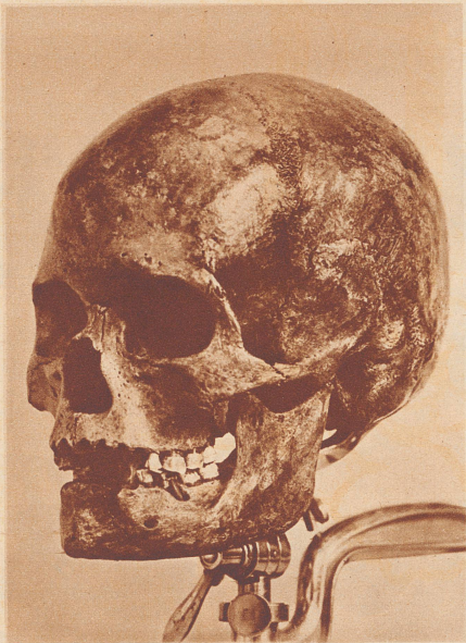
Aufnahme Prof. Schlaginhausen Schädel der Frau von Egolzwil.