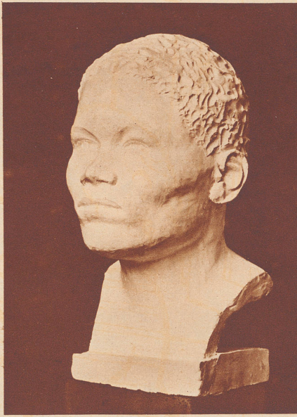
Rekonstruierter Kopf der Frau von Egozwil, ausgeführt von Rosa Koller, Wien